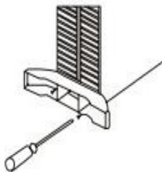
Рис. 1. Напольная установка